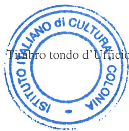
Timbro tondo d'Ufficio

Si dichiara che la presente graduatoria è stata affissa all'albo consolare il 17.08.2020